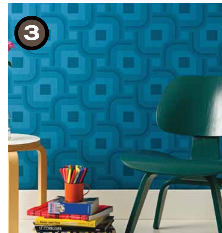
AMBIENTAÇÃO MOSTRA BLACK