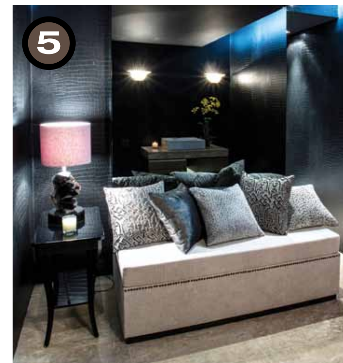
AMBIENTAÇÃO MOSTRA BLACK